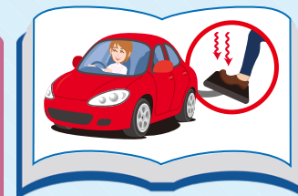
エコドライブの達人