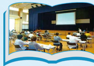
地球温暖化と暮らしの 関わりを伝える達人

「環境の達人」とは環境に関するいろいろな分野で幅広い知識と経験を持っているスペシャリストです。この事業では皆様の身近なエコ活動から、地球環境問題まで幅広い講座をサポートします。