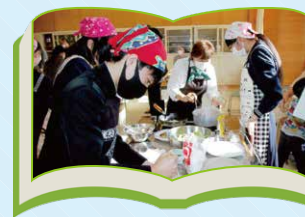
エコ・クッキング (地産地消)の達人