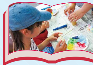
子どもでもできるリメイクの達人